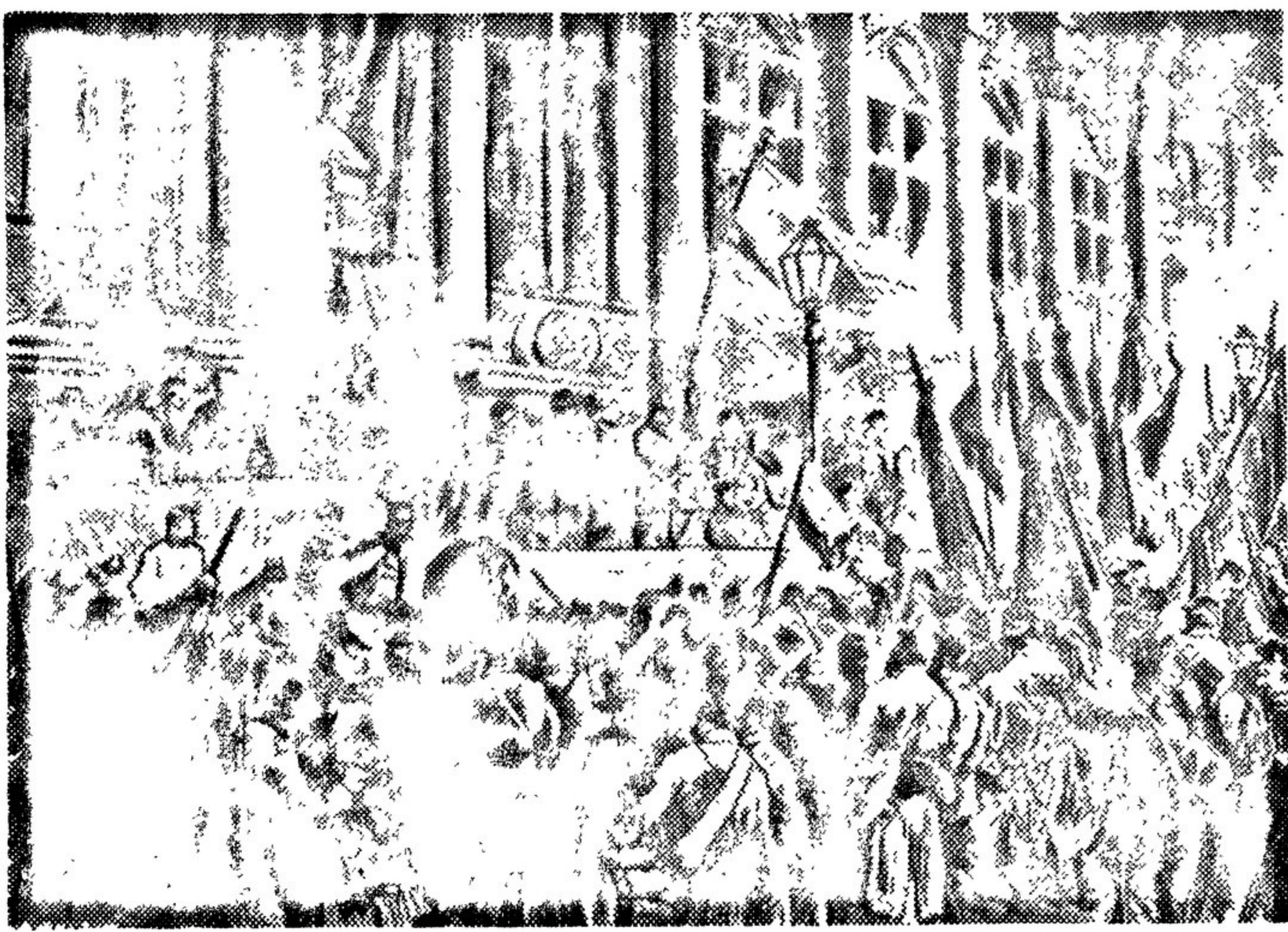
Провождение Парижской коммуны